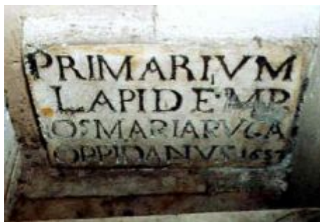
La Prima pietra dell'8 luglio 1657