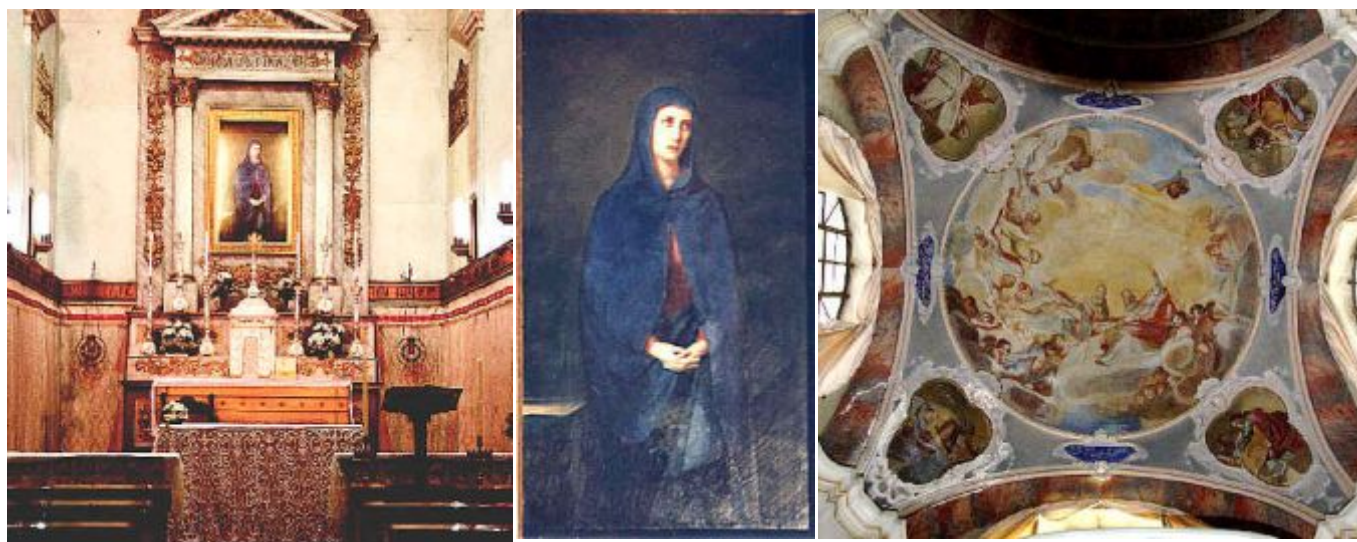
L'antico "coro" del Santuario, oggi Oratorio della Famiglia religiosa rosminiana