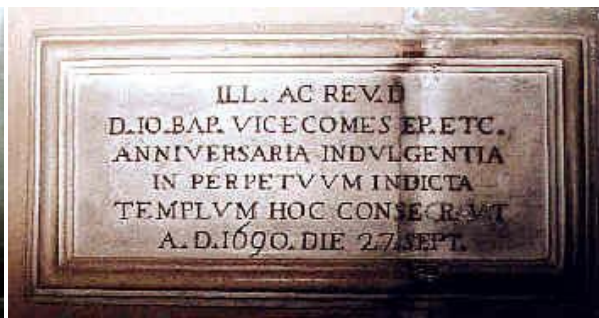
La lapide che segna la conclusione dei lavori e la consacrazione del Santuario il 27 settembre 1690