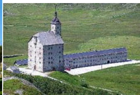
Sempione: Ospizio Stockalper