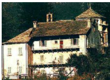
Lato sud di Casa Stockalper al Calvario