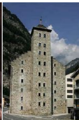
La torre Stockalper a Gondo