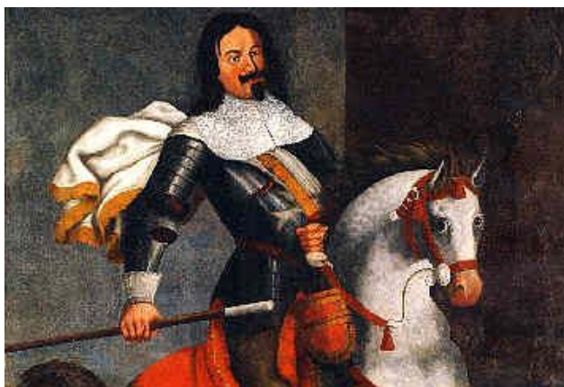
Kaspar Jodok von Stockalper

Un'effigie del barone Stokalper fu riprodotta in una statua che rappresentava il re mago Gaspare nella cappella della Visione della Croce e poi definitivamente spostata nella cappella XV dedicata alla Risurrezione.