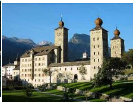
Briga: Castello Stockalper