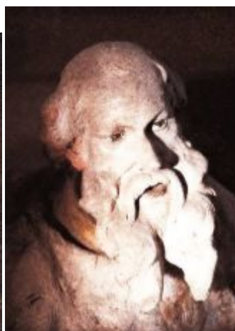
L'effigie del Barone Stockalper nella XV cappella della Via Crucis