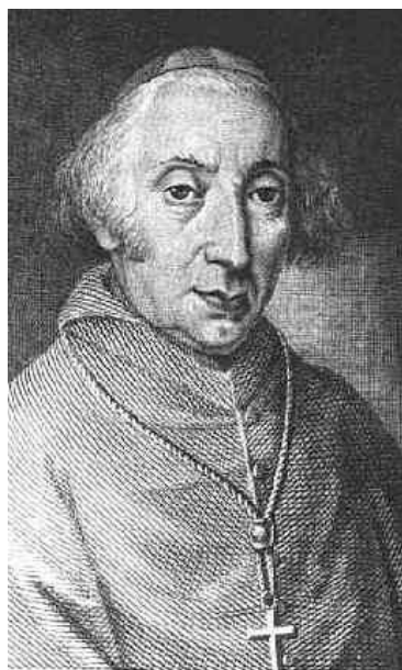
Il Cardinale Giuseppe Morozzo

Ancora vivo il Capis, e poi sotto il rettorato del Cugnone, fu completato il Santuario, fu eretto l'arco all'inizio della Via Regia Crucis e furono costruite le cappelle della II, IV e IX Stazione. Fu anche ridotta a piccolo santuario, dedicato alla Madonna delle Grazie , una edicola posta nella sella che congiunge il colle di Mattarella alla montagna e vi fu aggiunta una costruzione che ripete quella della S. Casa di Loreto .