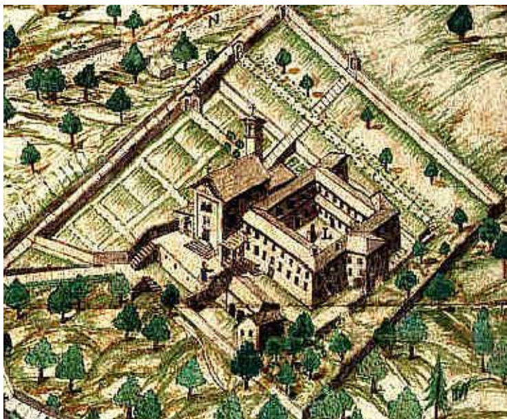
Chiesa ed ex Convento dei Cappuccini

Dopo di lui ebbero il canonicato e la rettoria del Sacro Monte Calvario il sacerdote Antonio Tripponetti , già parroco di Cisore , dal 1693 al 1739, il sacerdote Giacomo Silveti , già rettore del Santuario di Boca , dal 1739 al 1759, il sacerdote Antonio Malavi dal 1759 al 1799 e, dopo due anni di vacanza, dal 1799 al 1851 il sacerdote Remigio Capis . Ma già nel 1833 il cardinale Giuseppe Morozzo vescovo di Novara aveva affidato ai Padri del nuovo Istituto, fondato proprio al Calvario dal sacerdote Antonio Rosmini , l'opera del Sacro Monte, promovendo il restauro e lo sviluppo di questo monumento di fede e di pietà depauperato e disastroso e reso in gran parte inabitabile dagli eventi politici succeduti alla Rivoluzione francese.