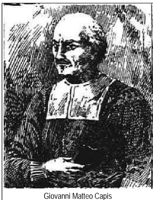
Giovanni Matteo Capis

Il giureconsulto Giovanni Matteo Capis (1617-1681) fu colui che si dedicò interamente all'opera del Sacro Monte Calvario, promovendone la costruzione, cercando i fondi necessari ed amministrandoli con estrema cura.