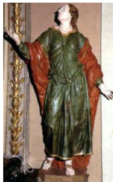
La statua di S. Giovanni Evangelista, nella XII stazione dopo il restauro

Dal maggio del 2002, poi, al Calvario è attiva anche una Stazione di ambientamento per rapaci notturni, un progetto avviato con la collaborazione della LIPU (Lega Italiana Protezione Uccelli, che ha finalità informative e didattiche, divulgative e scientifiche. Il diario registra meticolosamente «arrivi e partenze»: «6 agosto 2003, sono arrivati cinque nuovi gufi nella stazione di ambientamento per rapaci notturni; 3 settembre 2003, liberati i cinque esemplari di gufo comune, dopo circa un mese di permanenza; 5 maggio 2004: arrivo di due allocchi» e così via.