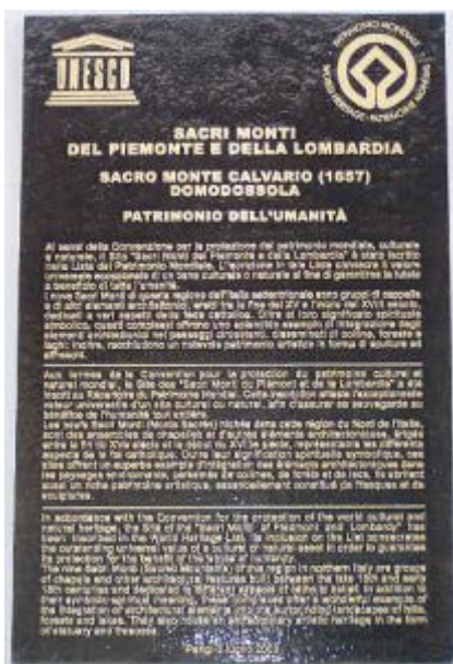
La lapide con il riconoscimento dell'UNESCO

L'elenco delle iniziative portate a termine e dei progetti in cantiere potrebbe continuare a lungo. Ma cifre e opere non saranno mai in grado di raccontare in modo adeguato la «rinascita» del Sacro Monte, la cui vita negli ultimi trent'anni assomiglia all'esodo biblico, dal deserto dell'abbandono alla terra promessa di un sogno realizzato. Un lungo cammino scandito dal nome dei tanti che in questi anni al Calvario hanno dedicato competenza, professionalità, contributi finanziari e idee: da chi si è succeduto alla guida della Riserva al personale, dai tecnici ai restauratori. E a questa «rinascita» ha contribuito in maniera fondamentale anche il visitatore o il pellegrino che quassù è salito, per immergersi nell'infinito, dove il silenzio degli anni bui ha lasciato il posto alle voci della vita che rinasce. La