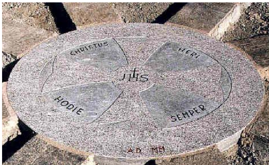
La scritta che ricorda il grande giubileo dell'anno 2000 al centro del sagrato antistante il Santuario

La sfida continua, lungo la strada tracciata dallo slogan, diventato negli anni missione e traguardo: Restituant nepotes montem quem sacrum voluerunt patres.