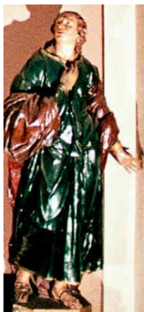
La statua di S. Giovanni evangelista, nella XII stazione prima del restauro

Il terzo millennio si è aperto con ulteriori e significative iniziative. L'inserimento del Santuario del SS. Crocifisso Sacro Monte Calvario tra le chiese giubilarie della diocesi di Novara portò lungo tutto l'anno 2000 circa 8.000 pellegrini a visitarlo per vivere l'indulgenza giubilare. E fu anche occasione per finanziare e realizzare progetti e interventi che ridessero al Sacro Monte il fascino che sembrava perduto e un nuovo ruolo all'interno della comunità locale. Una delle realizzazioni più significative fu il rifacimento del sagrato antistante il Santuario stesso che tornò a ripristinare con un elegante acciottolato la sua struttura originale, riprodotte il perimetro stesso della chiesa con al centro una lapide a perpetua memoria del giubileo.