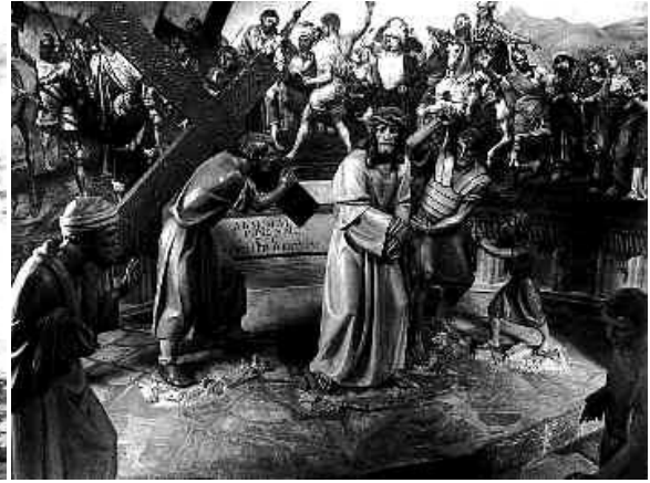
1957: posa del nuovo gruppo ligneo dei fratelli Denet e restauro dell'affresco