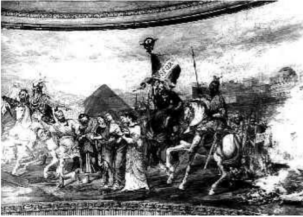
L'antico affresco dell'Hartman in cui si notano ancora le piramidi